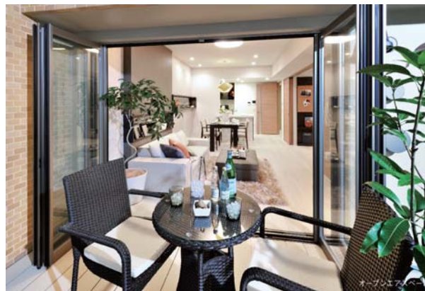
<サンプルルーム写真/オープンエアスペース>