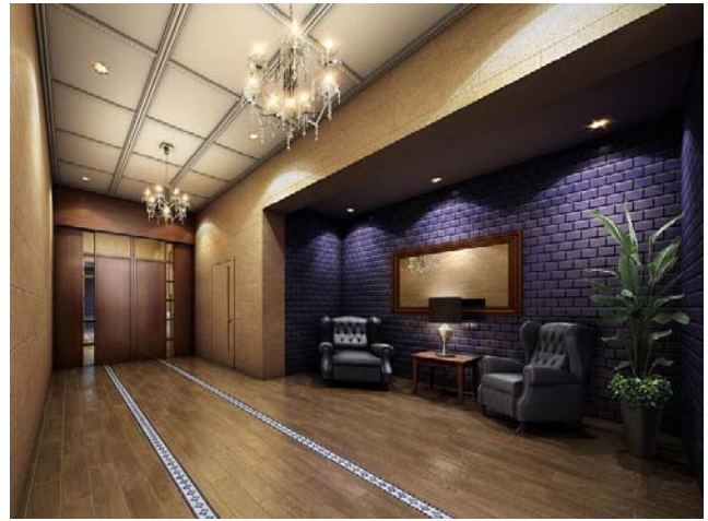
＜完成予想図／エントランス・エントランスホール＞

※掲載の完成予想図は計画段階の図面を基に描き起こしたもので、外観、外構、植栽等は実際とは異なります。また施工上の理由および行政指導などにより変更する場合がありますので、予めご了承ください。尚、敷地内の植栽は竣工から初期の育成期間を経た状態のものを想定して描いています。また、電線の位置は移設後の電柱の位置を想定して描いており、実際とは異なる場合があります。 ※掲載のサンプルルーム写真は2012年10月に撮影したものを一部CG加工したもので、造作家具等オプション品(別途費用)も含まれております。尚、家具・備品・調度品は分譲価格に含まれません。また、形状・仕様・色などは実際とは異なります。