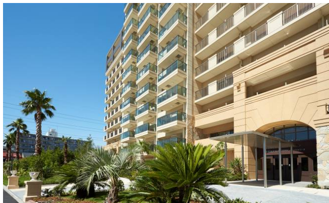
< II 街区メインエントランス >