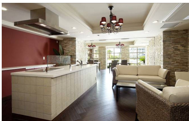
< II 街区パーティールーム >