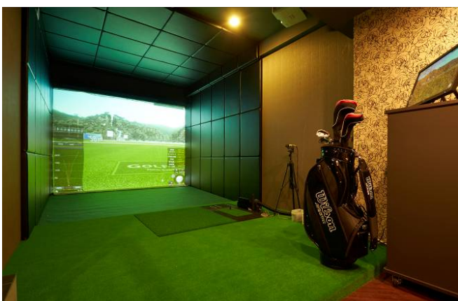
< I 街区マルチプレイルーム >