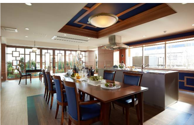
< I 街区パーティールーム >