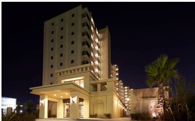
< I 街区メインエントランス >