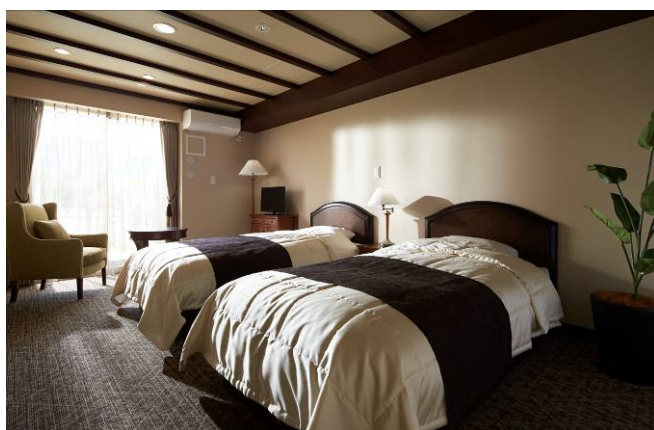
< II 街区ゲストルーム >

【本リリースに関するお問い合わせ先】 日本総合地所株式会社 経営企画室 鮎本（スシモト） TEL：03-3509-1387（直通） / E-mail： ir@ns-jisho.co.jp