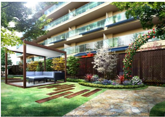
<ネーブルガーデン完成予想図>