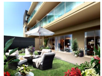
<プライベートガーデン予想図>