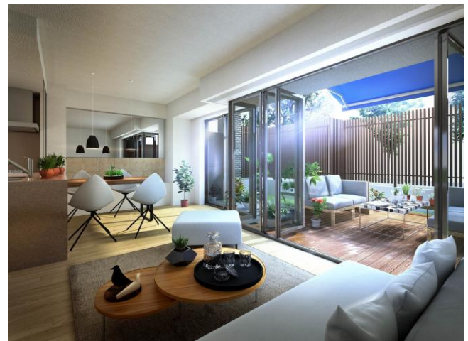
オープンエアリビング完成予想 CG

第一種住居地域に位置する建設地は、周辺が戸建中心の閑静な住宅地に囲まれ、子育てに適したロケーションが魅力です。二方道路の角地に、採光性や開放感を高められるよう南東・南西向きに住棟を配置。シマトネリコやシダレモミジ、ヤマボウシ、ヒメシヤラなど四季を彩る豊富な植栽で潤いに包まれる景観を創出しています。