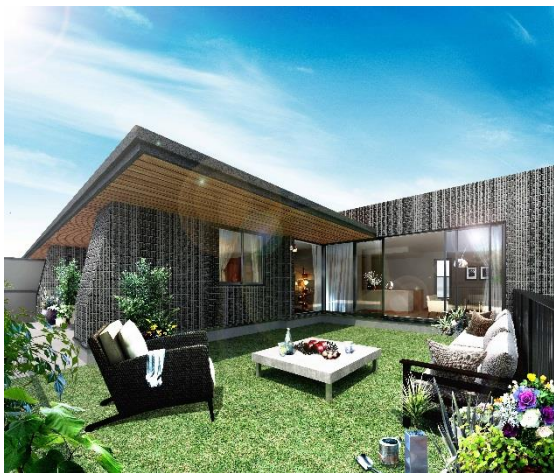
ルーフバルコニー完成予想 CG

全戸南東・南西向き。大きなルーフバルコニーや内廊下設計など上質な設えの最上階「ペントハウス」プラン、リビング・ダイニングとほぼフラットに繋がるアウトドア空間「オープンエアリビング」付プラン、ガラス窓に囲まれたとっておきの陽だまり空間「コンサバトリースペース」付プランなど、日常に新たな楽しみを加える多彩なプランを、住む人のスタイルに合わせて選ぶことができるように全 23 タイプをご用意いたしました。