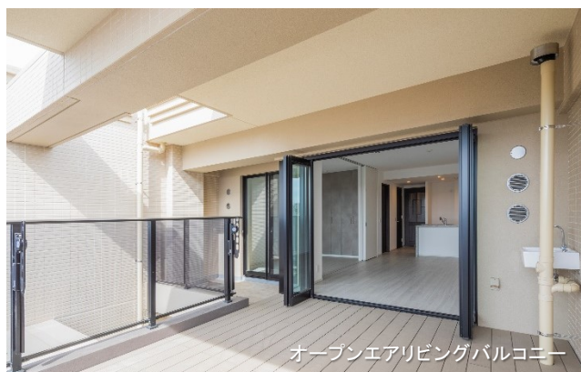
オープンエアリビングバルコニー