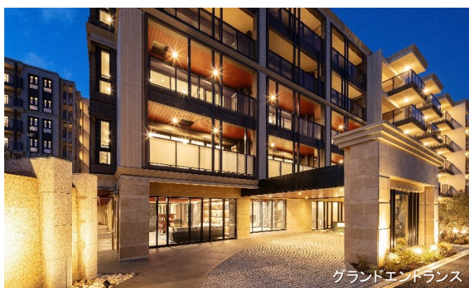
グランドエントランス