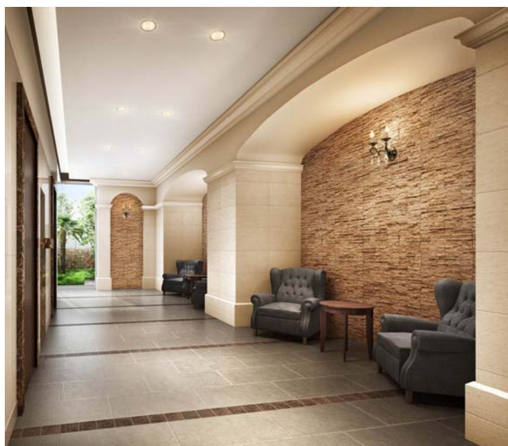
⑤エントラホール完成予想図