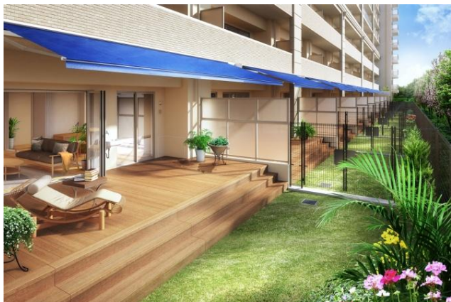
<オープンエアリビング完成予想図>

※掲載の完成予想図は計画段階の図面に基に描き起こしたもので、外観、外構、植栽等は実際とは異なります。また施工上の理由および行政指導などにより変更する場合がありますので、予めご了承ください。尚、敷地内の植栽は竣工から初期の育成期間を経た状態のものを想定して描いています。