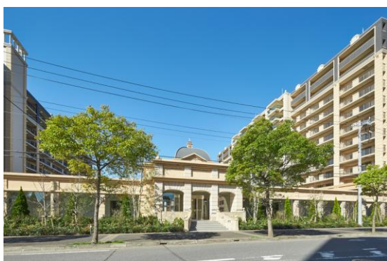
<メインエントランス>