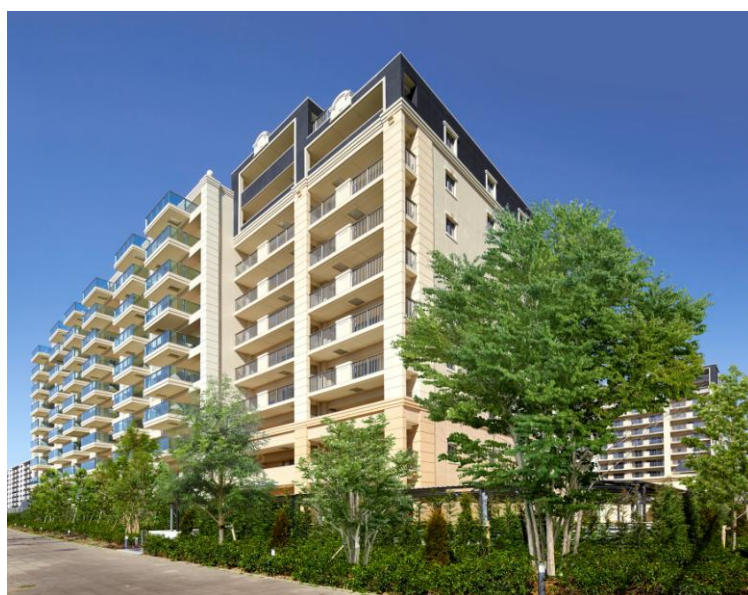
<ヴェレナシティ千葉ニュータウン中央 外観>