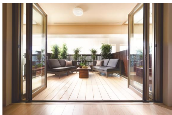
<オープンエアリビングバルコニー>