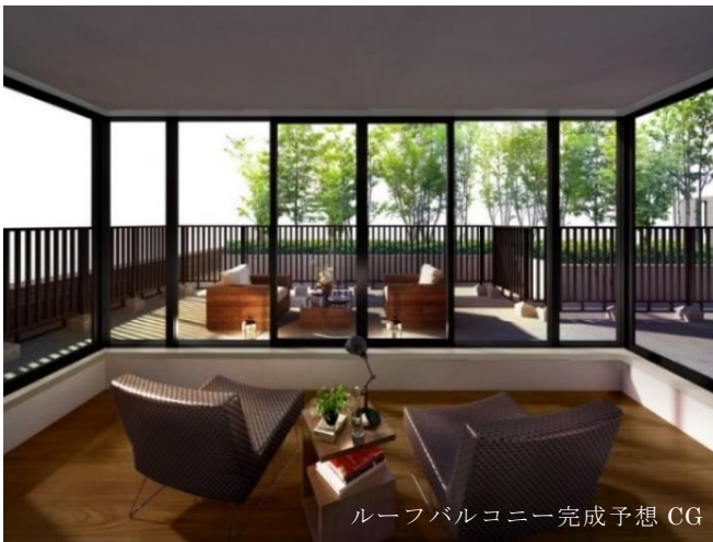
ルーフバルコニー完成予想 CG

Sr TYPE 3LDK+R+B+W 専有面積 82.11 m 2 バルコニー面積 12.77 m 2 ルーフバルコニー面積 39.46 m 2