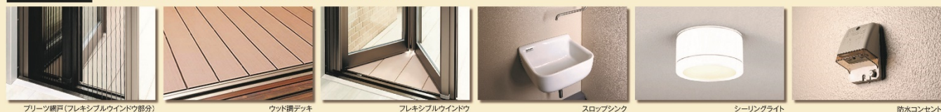
フリーツ欄戸(フレキシブルウインドウ部分)