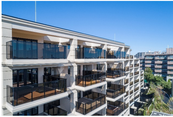
ヴェレーナグラン東戸塚(2020年分譲済)