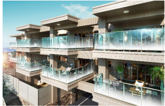
ヴェレーナグラン茅ヶ崎東海岸 神奈川県茅ヶ崎市