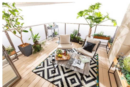
ヴェレーナシティ藤沢