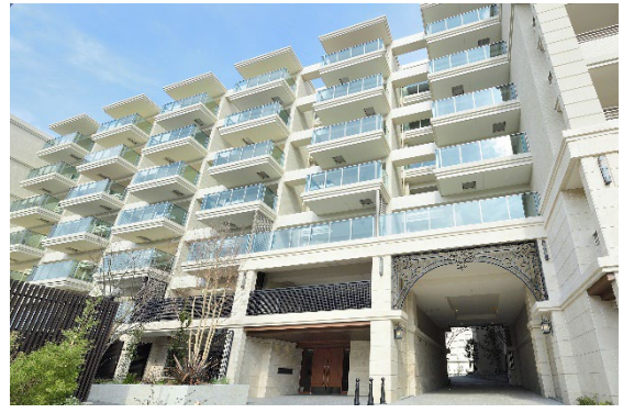
ヴェレーナシティ横浜根岸(2020年分譲済)