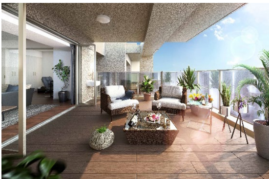
ヴェレーナシティ藤沢 神奈川県藤沢市