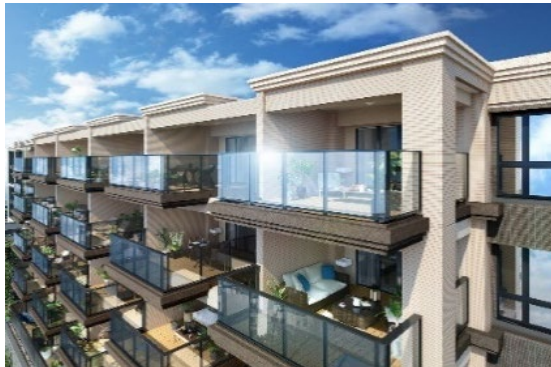
ヴェレーナシティ パレ・ド・マジェステ 神奈川県横浜市港南区