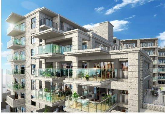
ヴェレーナシティ朝霞