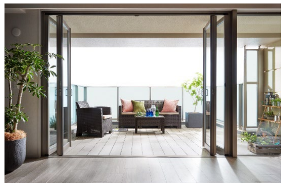
ヴェレーナシティ千葉ニュータウン中央アリーナ 千葉県印西市