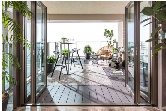
ヴェレーナグラン茅ヶ崎東海岸