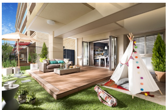
ヴェレーナシティ稲毛海岸(2018年分譲済)